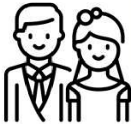
ЧИСЛО БРАКОВ ПО ВОЗРАСТУ ЖЕНИХА И НЕВЕСТЫ