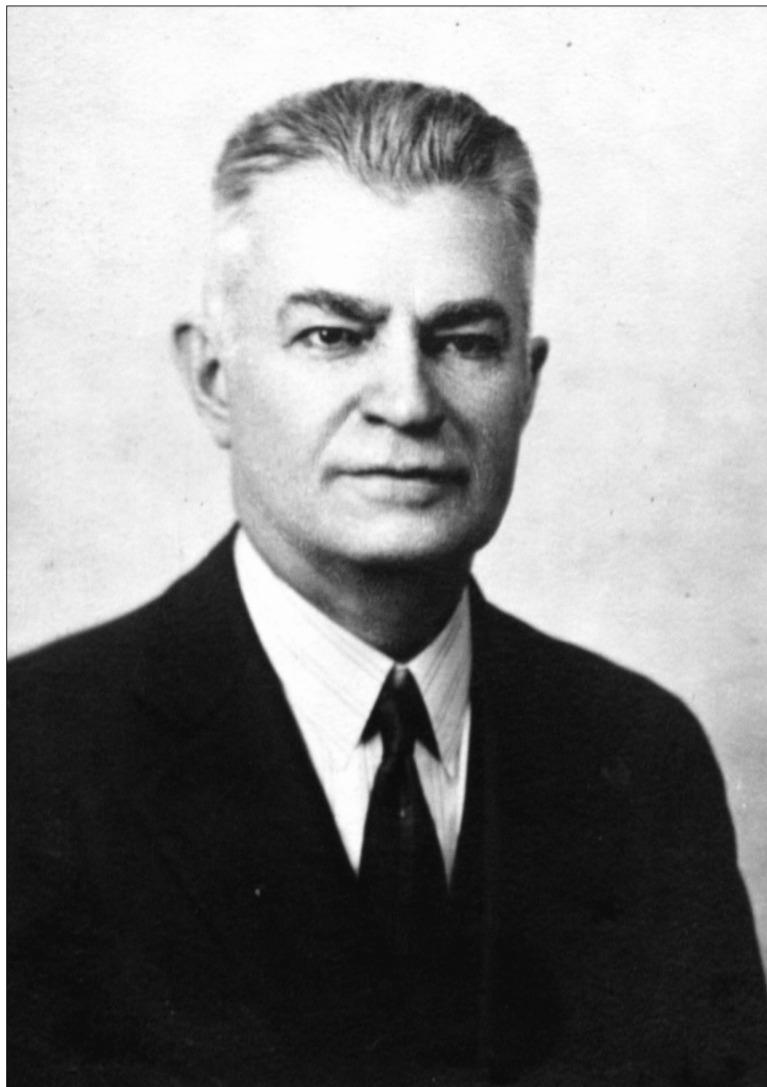
Иван Карлович Гибсон.